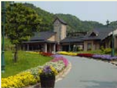
① 神崎農村公園ヨーデルの森 神河の自然や農業を食べて、遊んで、体験できる。 TEL:0790-32-2911