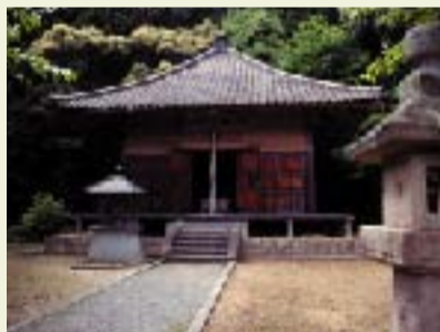
⑤ 日吉神社 大汝命と小日古尼命にまつわる神話が残っている。