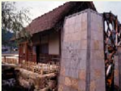
④ 水車公園こつとん亭 そば打ちやコンニャクづくり体験ができる。 TEL:0790-34-1666