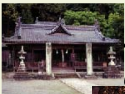
⑥ 長楽寺 十一面観世音菩薩像が有名。25年目に一度ご開帳。