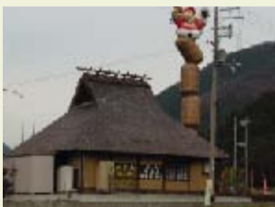
② かんざき大黒茶屋 名物店長が心をこめて作るうどん・そばがおいしい。 TEL:0790-32-2837